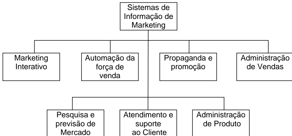
Figura 3 – SIM como apoio aos principais componentes da função de marketing

O'Brien (2004) explica que o marketing desempenha uma função vital na operação de uma iniciativa de negócio. “As empresas têm progressivamente se voltado para a tecnologia da informação como ajuda no desempenho de funções vitais de marketing diante das rápidas mudanças no ambiente de hoje.” (O'BRIEN, 2004, p. 174). Os sistemas de informação de marketing fornecem tecnologia da informação que apóiam os componentes principais da função de marketing (FIG. 3).